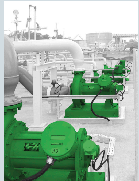
Einstufige Spaltrohrmotorpumpe Typ CNF 125-400