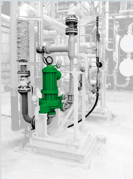
Einstufige Spaltrohrmotorpumpe Typ CNPFV 80x40x290